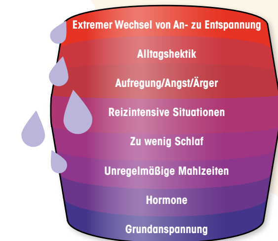
Grafik: Überschreiten der Migräneschwelle

Migränebetroffene weisen eine besondere Art der Informationsverarbeitung auf. Es handelt sich sozusagen um ein „Hochleistungs-Gehirn“, dem es schwer fällt, sich von äußeren Reizen abzuschildern und das einen hohen Energieverbrauch hat. Entsteht eine Überlastung des Systems, kann es zur Überschreitung der sog. „Migräneschwelle“ kommen.