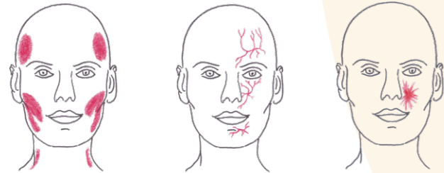
Abb.: Kiefer- und Gesichtsschmerzen haben verschiedene Ursachen.

Schmerzen in den Bereichen Gesicht, Kiefergelenke oder Mund sind häufige Beschwerden, weswegen sich Betroffene an ganz unterschiedliche Fachärzte wenden, zum Beispiel Zahnärzte, Hals-Nasen-Ohrenärzte, Kieferorthopäden, Neurologen oder Allgemeinmediziner. Ursachen für solche Schmerzen sind vor allem Entzündungen von Zähnen, Zahnhalteapparat, Knochen, Gelenken, Schleimhäuten, Nasennebenhöhlen oder Nerven im Kopf-Halsbereich. Auch Erkrankungen oder Verletzungen der Nerven, die diese Region mit Gefühl versorgen, können die Ursache für Schmerzen oder Taubheitsgefühle sein. Solche Schmerzen werden dann als „neuropathisch“ bezeichnet, was bedeutet, dass ein Nerv in irgendeiner Art geschädigt ist. Die Unterscheidung der Schmerzen nach deren Ursache kann nur durch eine sorgfältige körperliche Untersuchung getroffen werden und ist wichtig für die richtige Behandlung.