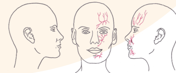
Abb.: Der Trigeminalnerv mit seinen drei Ästen.

Bei der Trigeminalneuropathie können die Schmerzen sowohl attackenförmig sein wie bei der Trigeminalneuralgie oder auch andauernd bestehen.