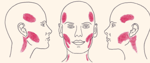
Abb.: Typischer Schmerzbereich bei Kaumuskel- und Kiefergelenkbeschwerden.

Merkmale: Typisch sind ein- oder beidseitige Schmerzen im Bereich der Wangen und/oder Schläfen, oftmals verbunden mit Nacken- oder weiteren Wirbelsäulenbeschwerden (s. Abb.). Diese Schmerzen können auch in die Zähne und/oder Ober- und Unterkiefer ausstrahlen, so dass sie schnell mit einer Erkrankung des Zahnes verwechselt werden können. Beim Abtasten der betroffenen Muskeln sind diese schmerzhaft, angespannt und verhärtet, möglicherweise auch verdickt. Häufig pressen diese Menschen unbewusst die Zähne, Zunge, Wangen und Lippen zusammen oder Knirschen mit den Zähnen (sogenannter Bruxismus), auch in der Nacht. Die Öffnung des Mundes kann erschwert sein.