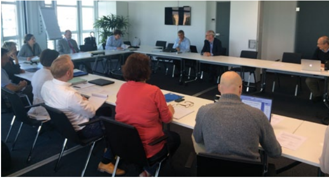
Abb. 4 ▲ EU-Projektplanung in Berlin am 3. Juli 2014

therapie durch kooperativ Bearbeitung gemeinsamer Handlungsfelder