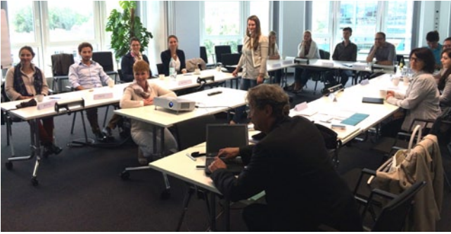
Abb.2 ▲ Diesjährige Juniorakademie in Berlin am 12.-14. Juni 2014