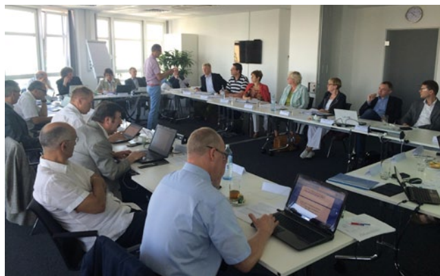
Abb. 1 ▲ LONTS-Konsensuskonferenz in Berlin am 4. Juli 2014

besser als noch so wohlgemeinte Einzelaktionen. In jedem Fall sollten wir massiv auftreten. Wir warten diesbezüglich auf die Vorschläge des BVSD, wie die optimale Strategie nach Meinung des BVSD aussehen kann. Die Deutsche Schmerzgesellschaft will fordern, die gesetzlichen Grundlagen der vertragsärztlichen Bedarfsplanung und ihre Ausgestaltung in der Bedarfsplanungsrichtlinie zu reformieren, um zukünftig im Hinblick auf eine bessere und nachhaltigere Versorgung von Schmerzpatienten die notwendigen Sicherheiten zu schaffen. Zum konkreten Vorgehen wird enge Abstimmung mit dem BVSD und der DGS erfolgen. Wir hoffen, dass wir hier zu einer gemeinsamen Forderung aller schmerztherapeutischen Gesellschaften in Deutschland kommen und auch diejenigen wissenschaftlichen Fachgesellschaften, für die die Schmerztherapie einen wichtigen Stellenwert innerhalb ihres Faches besitzt, mit an Bord zu bekommen (hierzu siehe unten).