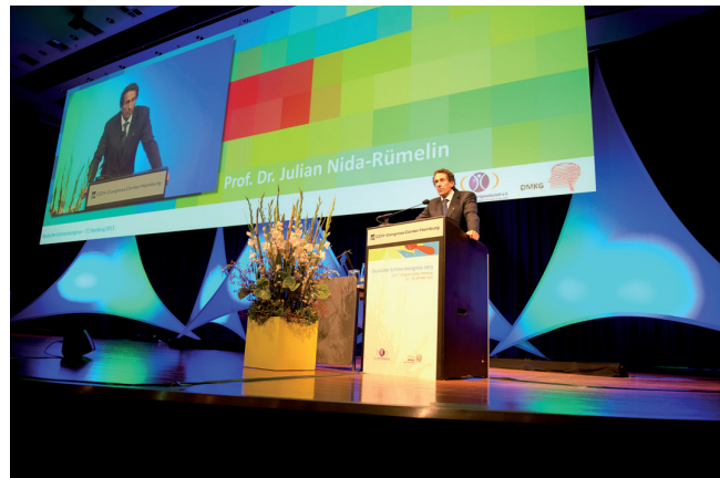
Abb. 1 ▲ Prof. Nida-Rümelin hielt einen nachdenklich-philosophischen Vortrag zum Thema: Was macht ein glückliches Leben aus? Die anwesenden Zuhörer haben jetzt das Rezept zum Glücklicherwerden, die anderen müssen weiter suchen...

Wir hatten Sie eingeladen, um mit Ihnen die Ideen für die weitere Ausrichtung der Deutschen Schmerzgesellschaft in den kommenden Jahren zu diskutieren und Ihre Meinung zu einigen strategischen Entwicklungen einzuholen. „Kurzer Blick auf