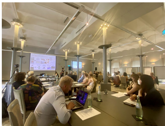
Abb. 1 ▲ Wissenschaftstag

Erfreulich auch: Unter dem Motto „Tauchen Sie mit uns ein in die Welt der Schmerzmedizin!“ bieten wir in diesem Jahr erstmalig rund 30 „Young Professionals“, also engagierten Nachwuchsschmerzmedizinerinnen und -mediziner in einem speziellen Förderprogramm die Möglichkeit, vertieft die Themen unserer alltäglichen Patientenversorgung, aber auch die wissenschaftliche Arbeit, zu entdecken und somit auch die Breite beruflicher und fachlicher Perspektiven der Schmerztherapie kennenzulernen. Das Programm richtet sich primär an junge Ärztinnen und Ärzte, die