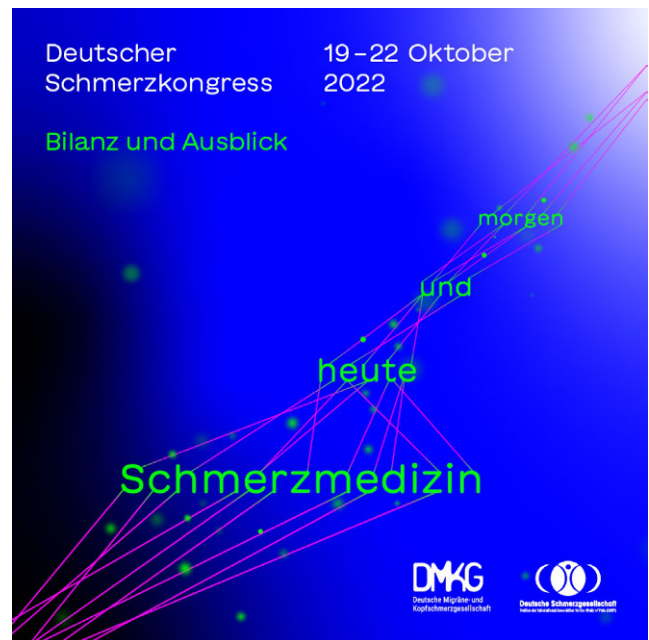
Abb. 5 ▲ Ankündigung Deutscher Schmerzkongress