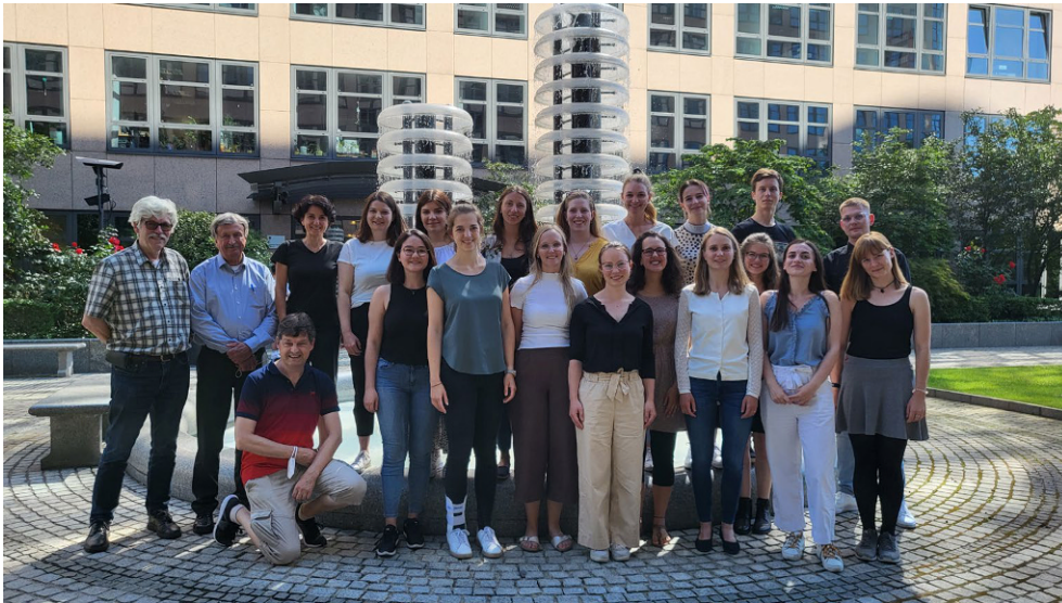
Abb. 3 ◀ Juniorakademie